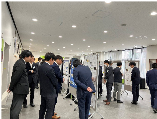
写真5 ポスター発表

ポスター発表は現地会場でのみの実施とし、発表者は2組に分かれ、ポスター発表時間を前半と後半に分けて開催した。