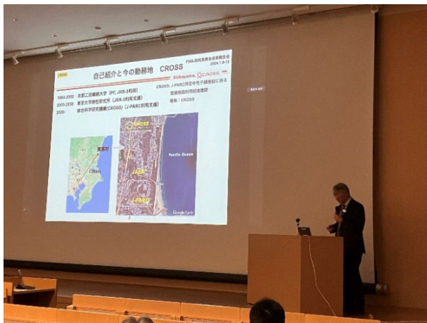
写真4 特別講演② 柴山充弘センター長

休憩をはさみ特別講演として、(一財)総合科学研究機構 (CROSS) 中性子科学センターの柴山充弘センター長より「放射光と中性子の発展的な利用に向けて」と題し、ご講演を頂いた。「放射光と中性子」はどちらも量子ビームとして物質の構造解析や物性研究には欠くべからざるツールとして定着しており、それ