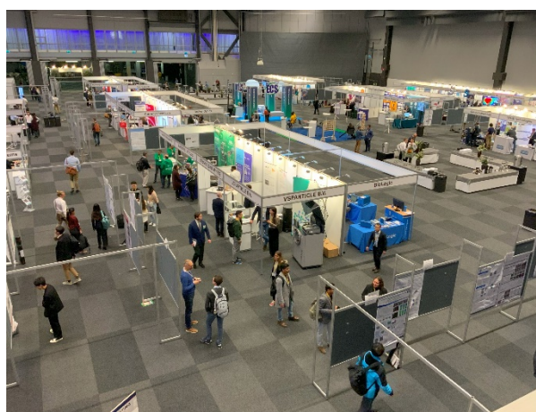
写真 3 ポスターセッション開始前のポスターおよび企業展示会場の様子。ポスターセッションが始まると、会場全体は (うんざりするほど) 異様な熱気に包まれていた。

両日の 18:00-20:00 ではポスター発表と企業展示を聴講した。写真 3 にポスターおよび企業展示会場の様子を示す。PI-KEM 社のブースでは、卓上型の乳鉢付き粉末試料混合機 (MSK-SFM-8) が展示されていた。コロナ禍を経て試料作製の自動化・ハイスループット化への動きが活発になっていて、本装置の需要も急激に増していると営業担当が話していた。前述した Cherevko 氏の講演状況も鑑みると、試料作製の自動化・ハイスループット化に対する関心がとても高いことがわかる。次に地元スウェーデンの会社で種々の電気化学セルを作製している redox.me 社のブースを訪問した。この会社ではラボの電気化学セルだけでなく、放射光実験専用の電気化学セルも納品しており展示ブースにおいても放射光実験用の電気化学セルが展示されていた。会場には営業だけでなく技術 (主に設計担当) の社員も参加していて、会場では電気化学セルの設計に関連する情報交換を行うことができた。なお今回ポスター発表の総数は 3 日間で 763 講演ということで、ポスターセッションが始まると会場内は多くの参加者で賑わっていた。ポスターセッションでは、燃料電池触媒の評価に関する講演を中心に多数聴講した。