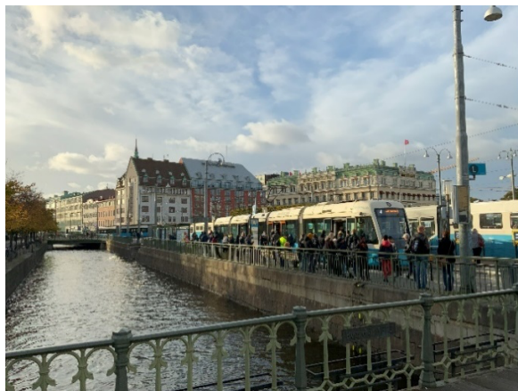
写真2 ヨーテボリ中央駅付近の繁華街の様子。

写真1は、会場となった Swedish Exhibition & Congress Centre および隣接するホテル Gothia Towers である。この会場はランドベッテル空港から高速バスで25分ほど移動した場所に位置する。またヨーテボリ中央駅を中心とする繁華街(写真2)からは2～3 kmほど離れており、会場付近はスポーツ競技場、遊園地や映画館といった興行施設が建ち並んでいた。さらに5～10分の徒歩圏内には美術館、博物館や図書館だけでなく Gothenburg 大学や Chalmers 工科大学などの文化的な施設も建ち並んでいて、朝夕の市街散歩はとても気持ち良かった。