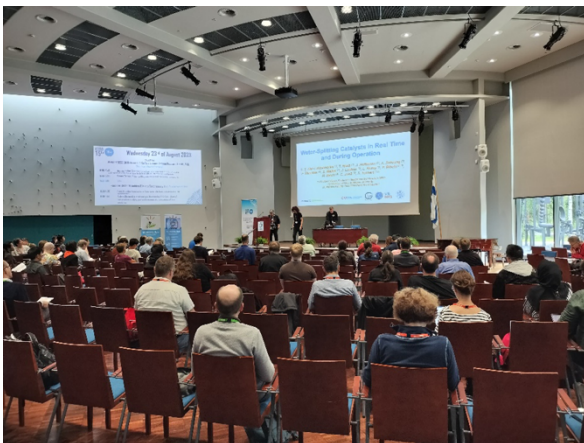
写真3 Plenary と口頭発表が行われた会場（Saalasti Hall）の様子。

会議の日程は、全日の午前前半にシングルでの Plenary session、以降は基本的に平行での口頭発表で構成され、他に 2 日目午後の Poster session と最終日の C. S. Fadley 氏を偲ぶ Memorial session が設定されており、各々の分野における研究報告と議論が