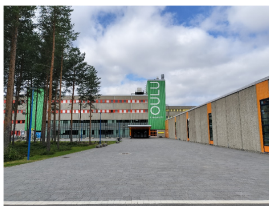
写真1 ICESS-15が開催されたUniversity of Ouluの外観写真。