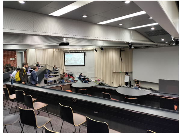
写真4 セッションが平行で開かれる場合に使用された講義室（Lecture hall L2）の様子。

進められた。写真3 および写真4 に口頭発表が行われた会場の様子、写真5 にポスター会場の様子を示す。