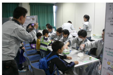
前回の施設公開の様子