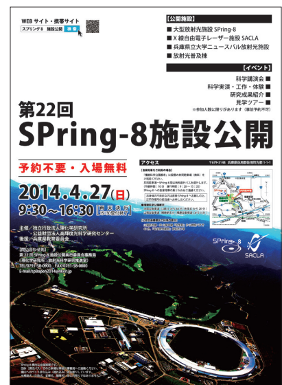
第22回施設公開ポスター

URL：http://www.spring8.or.jp/ja/news_publications/events/open_sp814/