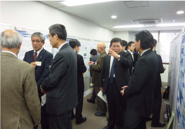
写真2 ポスター発表の様子