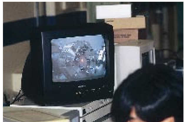
(a) BL10XUでの可視光ユニットによる光軸確認。モニター画面中央に光っているのがアンジュレータ光。フランジは、ICF70。

放射光が光学ハッチに導入され、光軸確認作業、分光結晶取り付け作業が行われた。一方で、夏前に調整を開始したビームラインの内では再開が遅れていたBL45XUでの調整作業もこの日に始まった。28日深夜の実験ホール内の作業風景および中央制御室（各挿入光源のギャップ操作は、現在のところ中央制御室から行われている）の様子を図1の写真に示す。翌29日には、第二陣までのビームラインでは殆どの調整作業を概成し、第三陣のBL39XU、BL10XUでも実験ハッチまで光が届いて調整の最終段階に入った。BL08Wでは300keVという今まで経験のない高エネルギー光を取り出すため、かなり手間取ったが、調整運転終了前日の10月2日になって、それらしい反射が確認され、さらに確認作業を続けている間に最終日を迎えた。