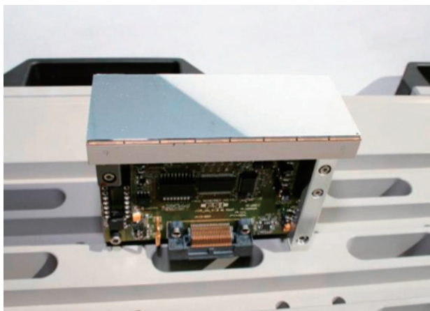
図1 PILATUSモジュール(ピクセルサイズ172 \mu\text{m} 、受光面積83.8 mm \times 33.5 mm、ピクセル数487 \times 195)

とにより、受光面を25.4 cm \times 28.9 cm、ピクセル数で1475 \times 1679に拡大した。全面積読み出し時フレーム率は最速30 fpsである。また、幾つかのモジュールを選択的に読み出すことも可能で、例えば中央の2モジュール読み出し時では200 fpsが得られる。ただし、垂直方向のモジュール間には7ピクセル、水平方向のモジュール間には17ピクセル、トータルで全面積に対し約8%の不感領域を含むことに留意する必要がある。