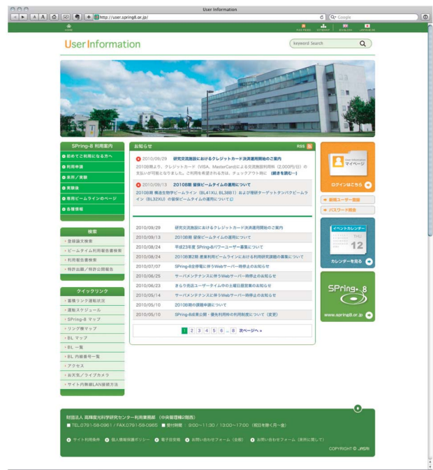
図1 トップページのイメージ

ログイン後に表示されるページが「マイページ」になり、利用業務部から各ユーザーへの「お知らせ」配信や「実験ホール入室に必要な手続き」状況、共用ビームラインの「利用実績統計」などの情報が表示されるようになりました【図2】。また、「マイページ」の左側には課題申請～来所前～退所時～実験後の各フェーズで必要なページへのリンクが一覧表示され、利用可能な機能が一目で分かります。