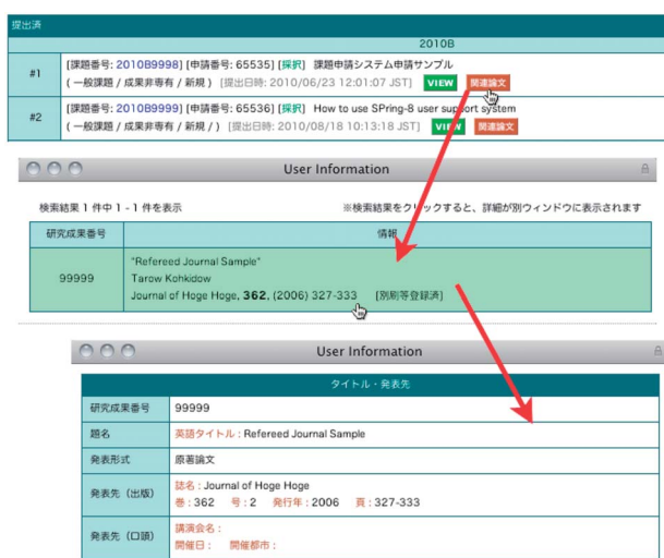
図3 課題と関連する論文リストの表示

申請課題ページの「提出済」課題一覧に『関連論文』ボタンが加わり、当該課題と関連する原著論文の一覧を表示できるようになりました【図3】。