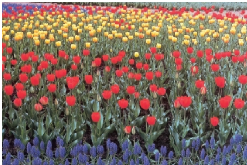
チューリップ園（光都二丁目）