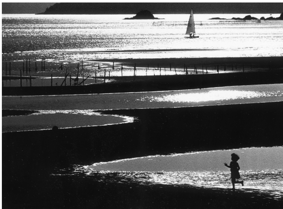
干 潟 (揖保郡御津町新舞子)