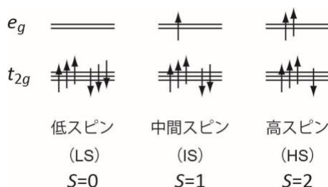
図 1. 3d 6 配置に対する 3 つのスピン状態。

一方、遷移金属 (TM) 化合物の TM 2p 共鳴非弾性 X 線散乱 (RIXS) では、スピン状態の変化に直接関係する dd 遷移の観測が原理的に可能であるが、低い信号強度等の問題から低いエネルギー分解能、1 eV 程度以上、で測定されていた。そのため、(準)弾性散乱ピークや電荷移動構造が重なってしまい、弾性散乱から 3 eV 程度ぐらいたまに現れる肝心の dd 遷移などの微細な構造を観測することが難しかった[7]。しかし近年、光源および測定器の性能向上によって低エネルギー励起をはっきり分離観測することが可能となってきた[8]。実験結果の解析の面でも、これまで使用されてきた MO 6 クラスタモデルより複雑な動的平均場を考慮したスペクトル解析が行われるようになってきている[9]。この解析を用いると LS 状態では起こらないが HS 状態などで起こりうる Co 3d バンドからの非局所遮蔽効果によるスペクトル構造を考慮できる。そのような構造は高エネルギー分解能測定で分離され重要となってくると考えられ、LaCoO 3 のスピン状態の同定に役立つと期待される。以上の観点より、本研究では、LaCoO 3 の Co 2p RIXS の温度変化を高エネルギー分解能で測定し、スピン状態変化に伴うスペクトル変化の観測を試みた。