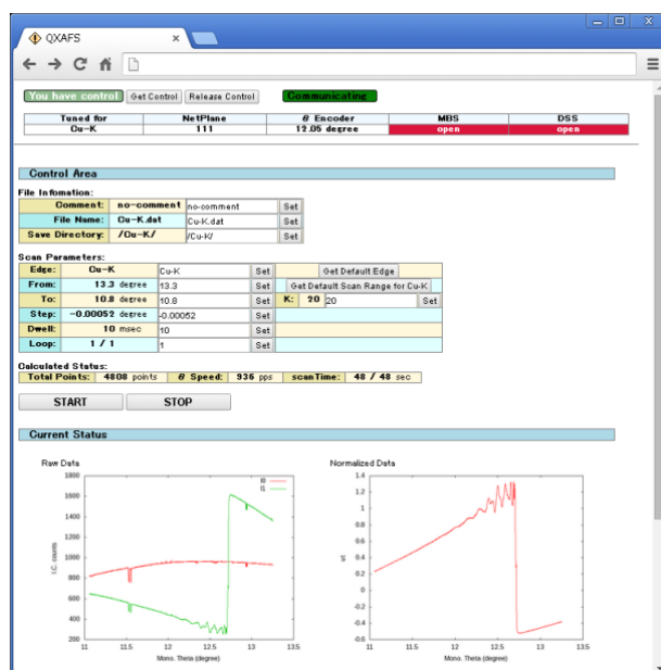
図2 QXAFS ウェブクライアント